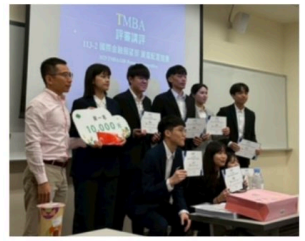
國泰 X TMBA 資產配置競賽