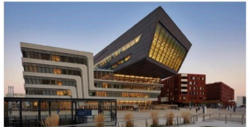
Vienna University of Economics and Business

在完成交換計畫後，我希望將交換期間累積的學習經驗與跨文化視野，實際應用於未來的學業與職涯發展中。我期望自己未來能在國際化程度較高的 金融產業中發展 ，並結合交換期間所學，提升自身的 分析能力與國際觀 ，善用跨文化溝通能力，參與 跨國業務或國際市場相關工作 。同時，我也希望將自身的交換經驗分享給學弟妹，鼓勵更多人勇於走出舒適圈並拓展視野。