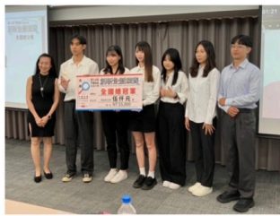
13 屆 TBSA 大專創新企劃競賽