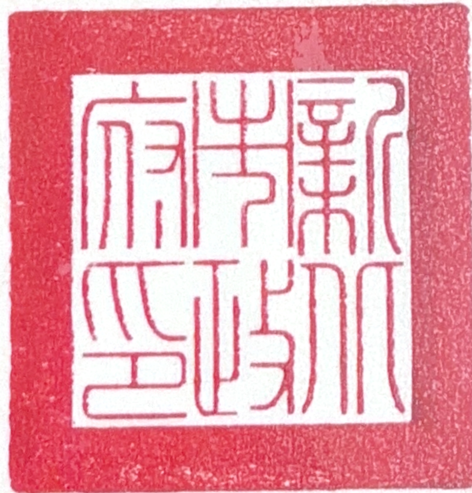
Mayor of New Taipei City