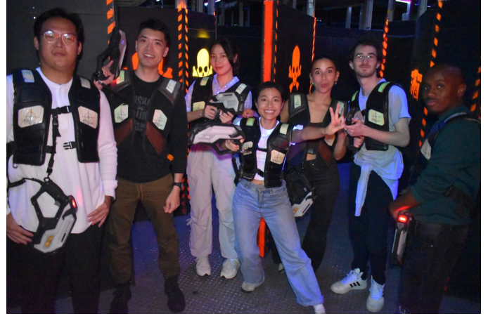
圖二、安排與外國同學課外活動