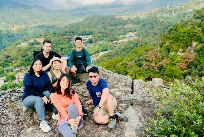
圖一、安排與外國同學登劍龍嶺

供我所需的商業視角與全球市場理解。若有幸獲得獎學金，不僅能減輕海外研修期間的經濟負擔，使我能專注於學習與交流，也將支持我未來協助台灣產業拓展國際市場、提升競爭力的目標。