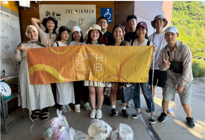
圖三、參與 Oath Club 觀音山淨山